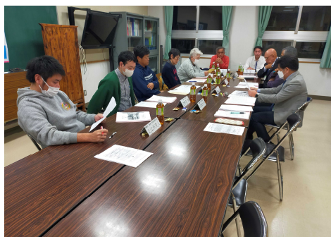
協議会終了後の別室学習室の確認